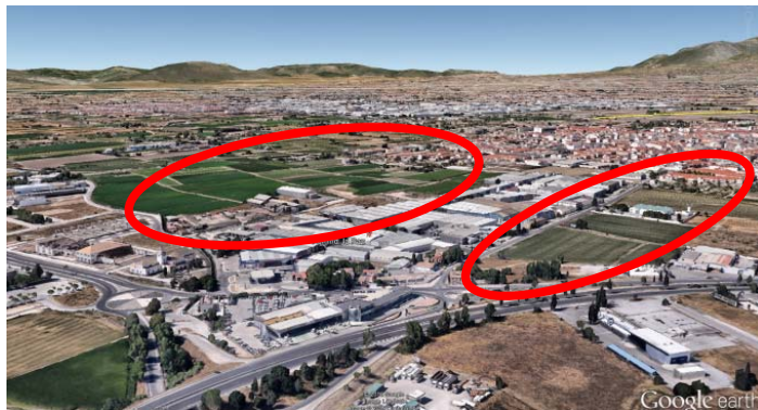
Actuaciones en espacios degradados junto Pol. Ind. La Paz.

Esta actuación en espacios y en zonas verdes para uso colectivo, permite la generación de nuevos espacios verdes donde ahora existen zonas abandonadas y degradadas. Se tendrá especial preferencia por la conversión de zonas degradadas provenientes de descontaminación de suelos, como pueden ser las zonas cercanas a los polígonos industriales de la ciudad.